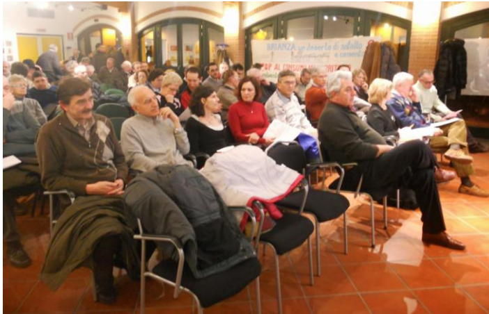
I partecipanti alla serata

La serata si è svolta al Centro Civico Terragni di Camnago con circa un centinaio di partecipanti .