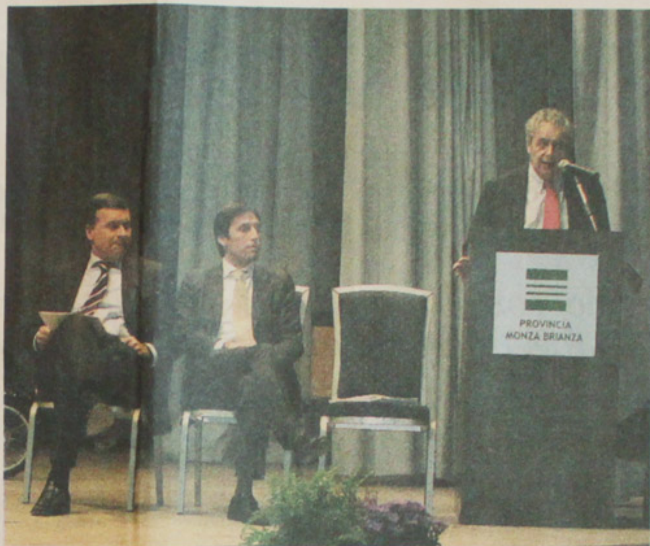
Il potere reale della nuova provincia

Poi ha posto l'accento sull'agricoltura come risorsa economica, tornando al titolo del convegno, che ricorda come l'ambiente è un capitale. «Da tutelare sempre».