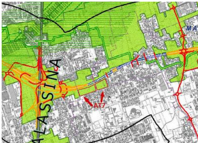
Lissone: la Rete Verde di Ricomposizione Paesaggistica (art.31 del PTCP) con connesso buffer di inedificabilità della Pedemontana (art 32 PTCP) e l'AT7 (in rosso)

Si perchè, le palazzine previste nel progetto edilizio dell'AT7 sarebbero state a ..... vista autostrada.